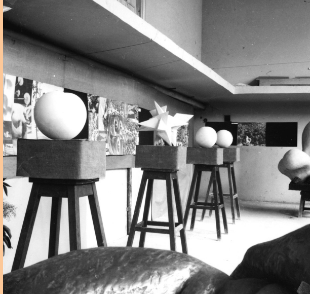
Autor nieznany, Wystawa prac dyplomowych w pracowni Jerzego Jarnuszkiewicza, 1963